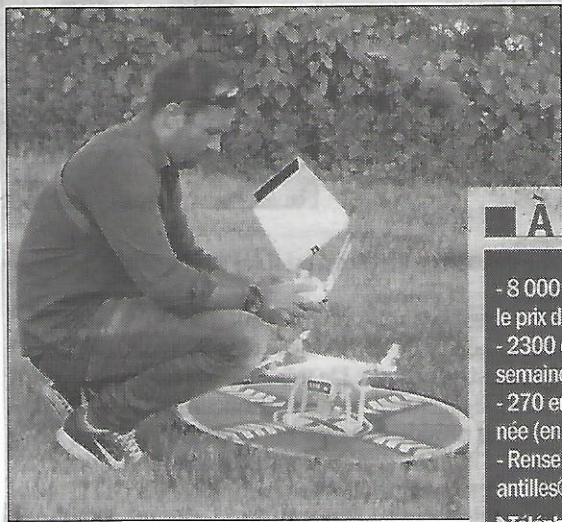
Un futur professionnel teste son appareil.

Ces futurs professionnels apprennent aussi différentes techniques sur des appareils performants, exemple, la thermographie basée sur l'infra-